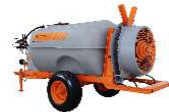
ARBUS 2000 TF 725