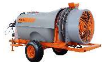
ARBUS 2000 TF 3P