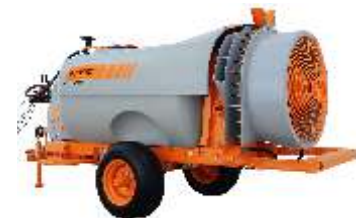
ARBUS 2000 TF 2 P