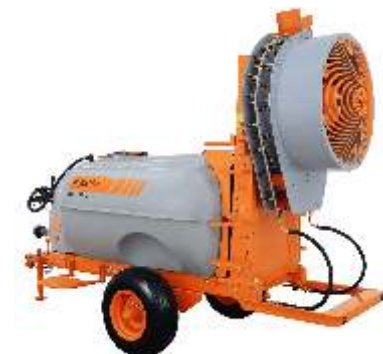
ARBUS 2000 TF VA