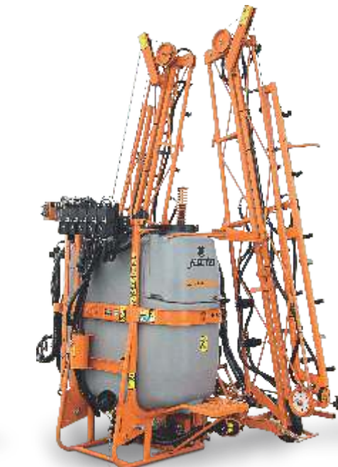
CONDOR 800 AM 18