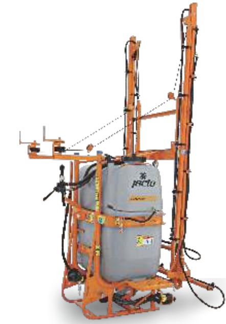
CONDOR 800 M 12