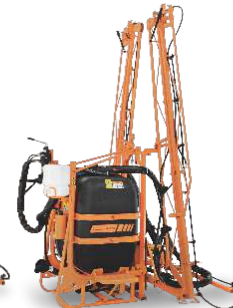
CONDOR 600 AM 14