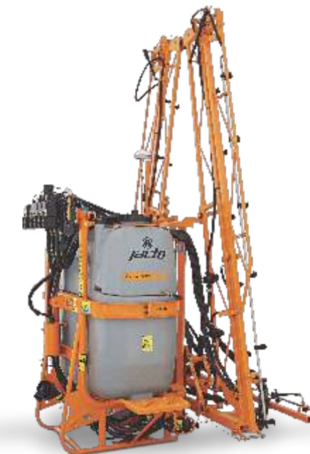
CONDOR 800 AM 12 / AM 14