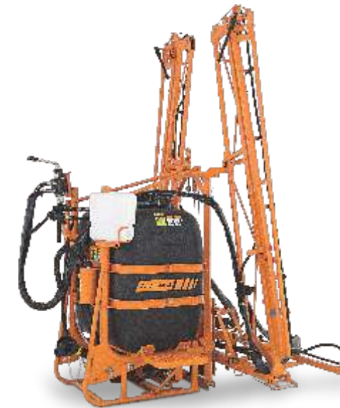
CONDOR 600 AM 12