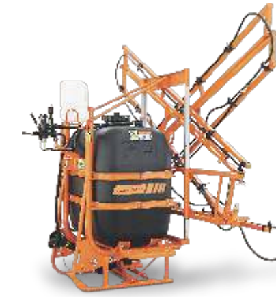
CONDOR BX 12