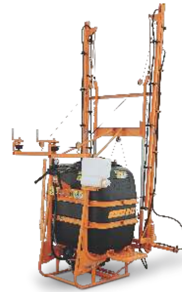
CONDOR 600 M 12