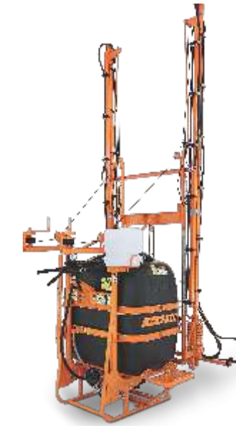
CONDOR 600 M 14