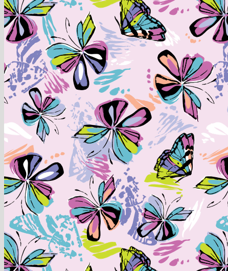
PAPILLONS EN FÊTE (BUDE)