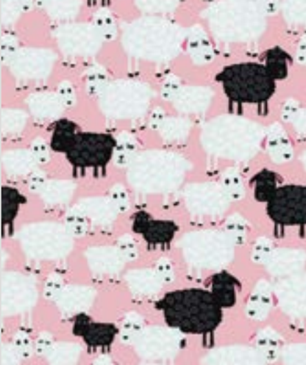
BÊ BÊ MOUTON NOIR (BBBS)