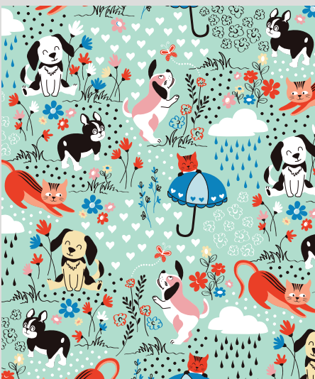
CHATS ET CHIENS COPAINS (RCAD)