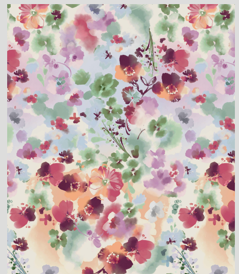
RÊVES AQUARELLE (WADR)