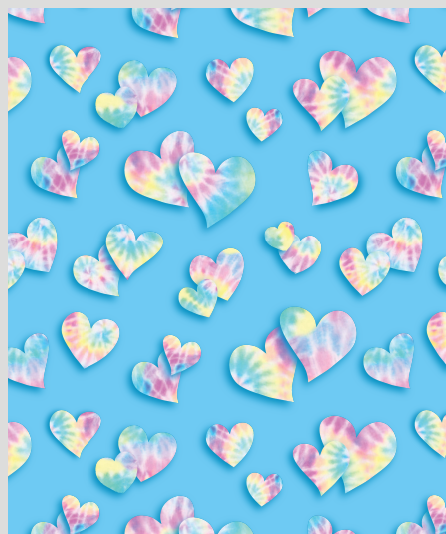
COEURS TENDRES (TDLO)