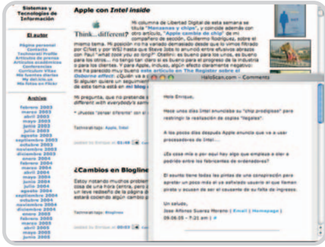
El sistema de comentarios de un blog (en este caso el de Enrique Dans, www.enriquedans.com ) es una forma sencilla de participar.

formación sino también para dotarla de mayor veracidad y credibilidad. No es lo mismo, por ejemplo, aseverar llanamente que un individuo determinado ha asistido a la inauguración de una escuela, que soportar esa afirmación con una fotografía o con un enlace al sitio web de esa persona en donde explica las razones por las cuales concurrió a ese evento.