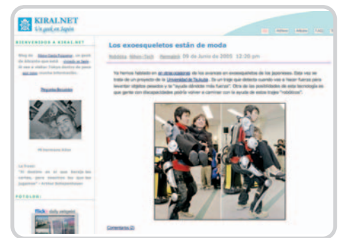
Kirai.net es una de las bitácoras con más éxito en Internet.

Del mismo modo, algunos sistemas de publicación de bitácoras permiten categorizar las entradas según su contenido. Es otra forma de or-