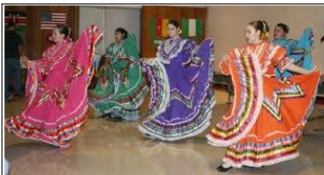
El Alma Folklórica Bailarines de Guymon, OK

zón cariñoso. Ella visita a las aulas todos los días y ofrece oportunidades de aprendizaje para los profesores sobre una base regular. Además del apoyo prestado por la Sra. Waldorf, profesores y estudiantes de Garfield también utilizan la tecnología sobre una base diaria para impactar estudiante inclinado. Los maestros utilizan pizarras interactivas, ELMO, de pizarras interactivas, Mobi y portátiles de forma regular para proveer instrucción poderosa mientras que la integración de la tecnología. Los estudiantes de Garfield disfrutan con los iPads durante el grupo de intervención y de poca monta. Este año hay tres carros de iPad para los niveles de grado para compartir. Los estudiantes utilizan los iPads para practicar la lectura, la escritura y las matemáticas a través de una variedad de aplicaciones educativas y de calidad adecuadas que están disponibles.