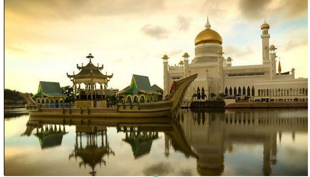
Omar Ali Saifuddin Mosque, Brunei