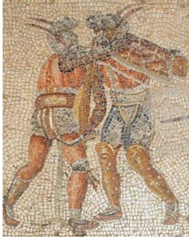
"Ancient Greece, the originator of Democracy and, interestingly enough, of Sport too as public entertainment"

citement!" This saying of yours, however, is threadbare and has no real substance!