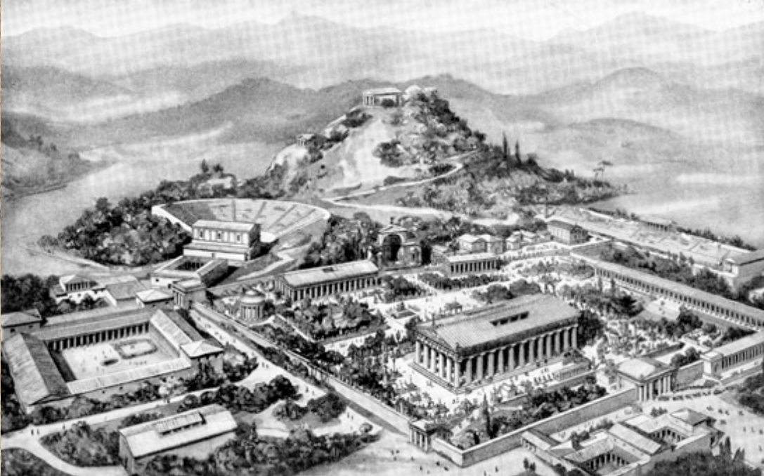
"Çok ilginçdir, Yunanistan hem Demokrasinin çıkış noktası, aynı zamanda ilk defa sporun da bir halk eğlencesi haline geldiği yerdir."

Hayrı asla yok şerri hisaba gelmez. Küçük büyük herkes Futbol tutkusuyula her şeyi unutmuşlar ne çocuklar derslerine, ne büyükler kendilerine büyüklük kazandıracak hedeflere ulaşamıyor varsa yoksa boş topun arkasında sahalarda deli deli koşturanlara hay vermekten başka kaygı ve dertleri olmayan bir guruh olmuşlardır.