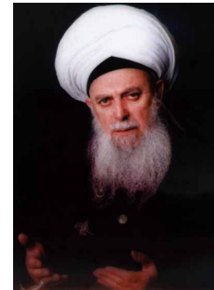
Mawlana Sheikh Nazim

VOL. 2, ISSUE 11: 20 RABI' AL-AWWAL 1431 4 MARCH 2010