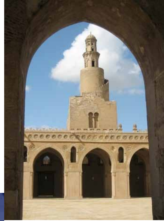
UP: The mosque of Ibn Tulun, Cairo.