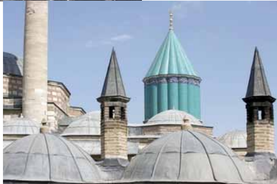
DOWN: Towers from Salimiya, Konya.