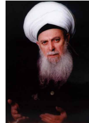
Mawlana Sheikh Nazim

VOL. 2, ISSUE 14: 18 RABİ AL-AKHİR 1431 2 APRIL 2010