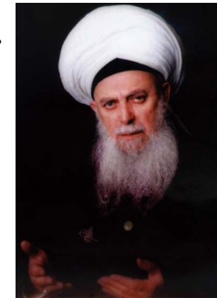
Mawlana Sheikh Nazim