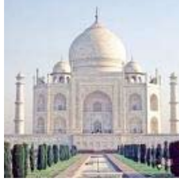
above: Dolmabache palace left: Taj Mahal below: Mihrimah Sultan