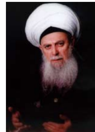
Mawlana Sheikh Nazim

VOL. 1, ISSUE 10: 12 RABI' AL-AWWAL 1431 26 FEBRUARY 2010