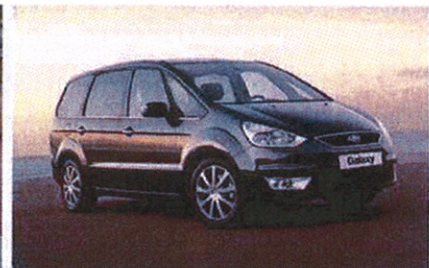
Le Ford Galaxy Taxi de l'année 2008-2009 dans la catégorie « Monospace ».

Déjà récompensé l'an passé dans la catégorie « Monospace » avec le Grand C4 Picasso, Citroën reçoit cette année le trophée Taxi de l'année 2008-2009 dans la catégorie « Berline » pour la Citroën C5 2.0 HDi 138. Il est vrai que la berline de la marque aux Chevrons ne manque pas d'allure avec sa ligne racée et l'incrustation du célèbre logo dans des baguettes chromées qui rejoignent deux projecteurs en œil de biche. Par ailleurs, son confort et sa performance lui permettent d'accéder dignement au segment des véhicules statutaires et de séduire les chauffeurs de