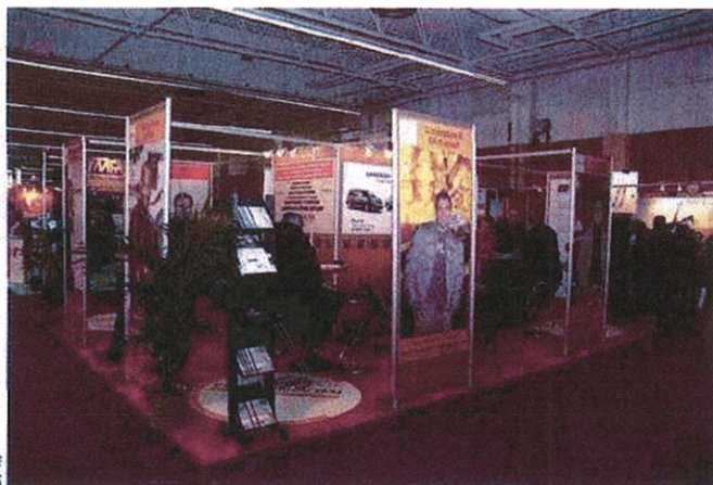
La précédente édition qui s'était tenue en 2007 avait remporté un franc succès.

Le Salon des Taxis tiendra sa neuvième édition les 7 et 8 février 2009 à Paris. L'occasion de rencontrer les principaux acteurs de la profession.