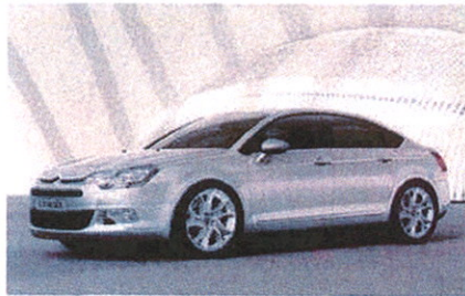
La Citroën C5 est élue Taxi de l'année 2008-2009 dans la catégorie « Berline ».

Cette année encore, le trophée Taxi de l'année a été décerné dans trois catégories distinctes : berline, break et monospace. Les vainqueurs de l'édition 2008-2009 sont la Citroën C5, la Mercedes Classe C en version break et le Ford Galaxy.