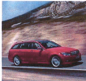
La Mercedes Classe C break est élue Taxi de l'année 2008-2009 dans la catégorie « Break ».