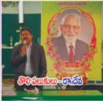
శ్రీశ్రీ పలుకులు - డా॥దేవ