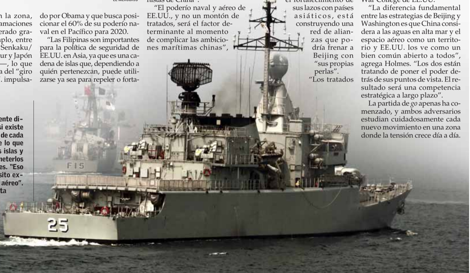
NAVES DE OCHO PAÍSES de Asia participaron la semana pasada en ejercicios marítimos organizados por China en la costa de Qingdao, en la provincia de Shandong.

"Pero al mismo tiempo, creo que EE.UU. malinterpreta las aspiraciones de China. Muchos funcionarios y analistas simplemente no pueden creer lo que China dice. Entonces buscan segundas intenciones", agrega el analista del Naval War College.