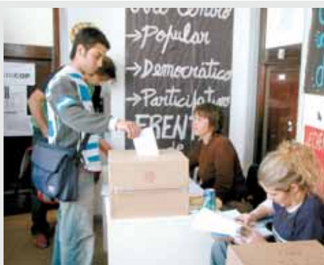
A las urnas. Los comicios estudiantiles terminan mañana