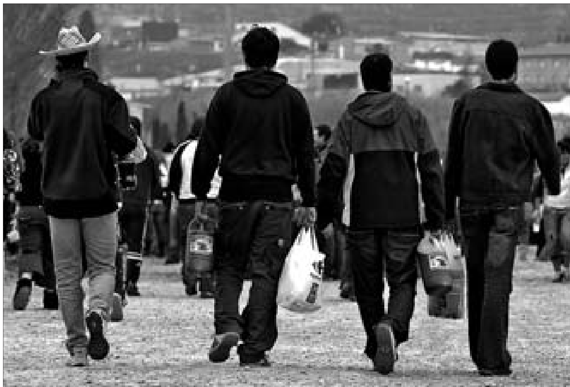
Cuatro jóvenes pertrechados de alcohol, refrescos y comida se dirigen a la zona del 'botellón' organizado ayer en Zaragoza.

El 'botellón oficial' de la ciudad andaluza bate todos los récords en una jornada que la Policía y la lluvia desinflaron en muchos lugares