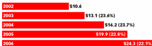
US Retail E-Commerce Holiday Sales, 2002-2006 (billions and % increase vs. prior year)

Note: Sales are for November and December of each year; excludes online travel and event ticket sales Source: eMarketer, October 2006