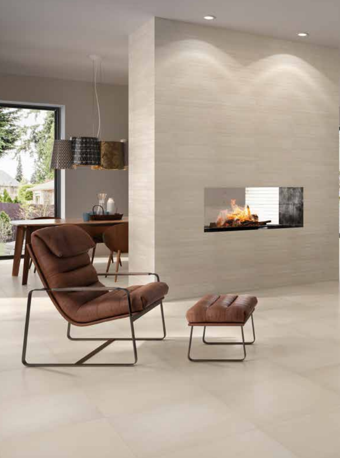
Wand- und Bodenfliesen | Wall and floor tiles: SECTION creme-weiß | creme-white