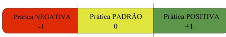
Figura 1. Escala de gradação para a avaliação de cada critério no ISMAS. Figure 1. Rating scale for the evaluation of each criteria contained in ISMAS tool.