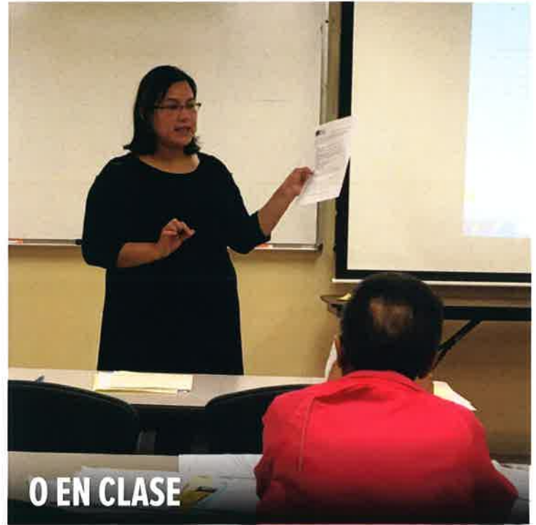
O EN CLASE

¡Asesoramiento financiero individual y gratuito para guiarlo a través de los tiempos difíciles de la vida!