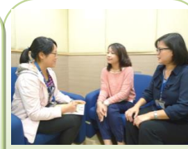
即時傳譯服務 Simultaneous Interpretation Service