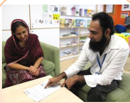
視譯服務 On-Sight Interpretation Service