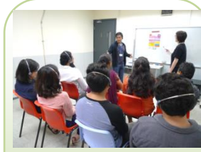
即場傳譯服務 On-Site (Escort) Interpretation Service