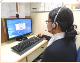
電話傳譯服務 Telephone Interpretation Service