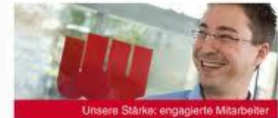
Unsere Stärke: engagierte Mitarbeiter