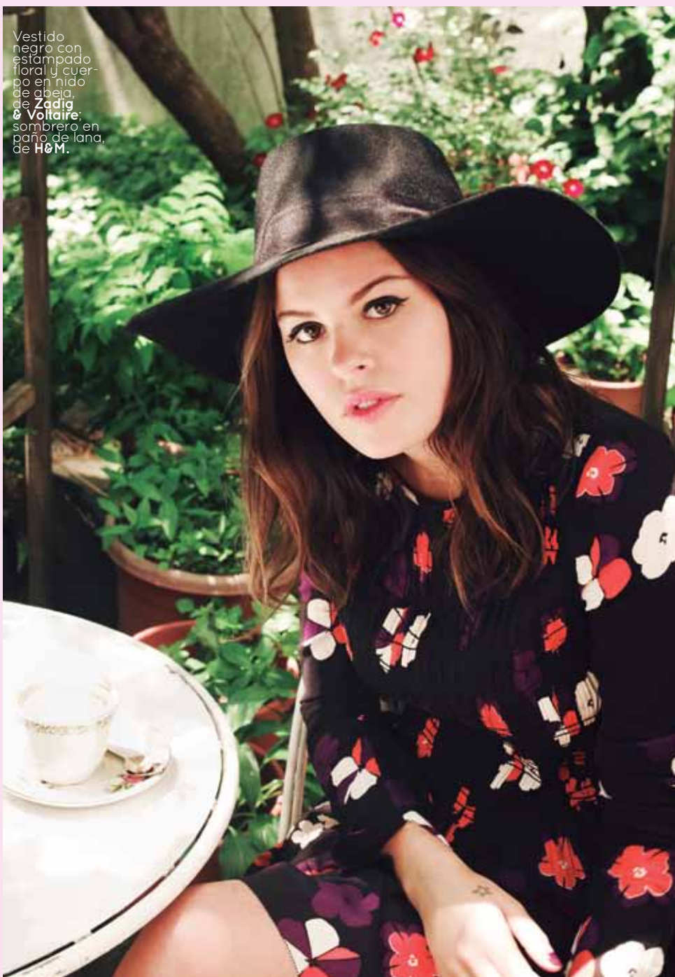
Vestido negro con estampado floral y cuerpo en nido de abeja, de Zadig & Voltaire; sombrero en paño de lana, de H&M.