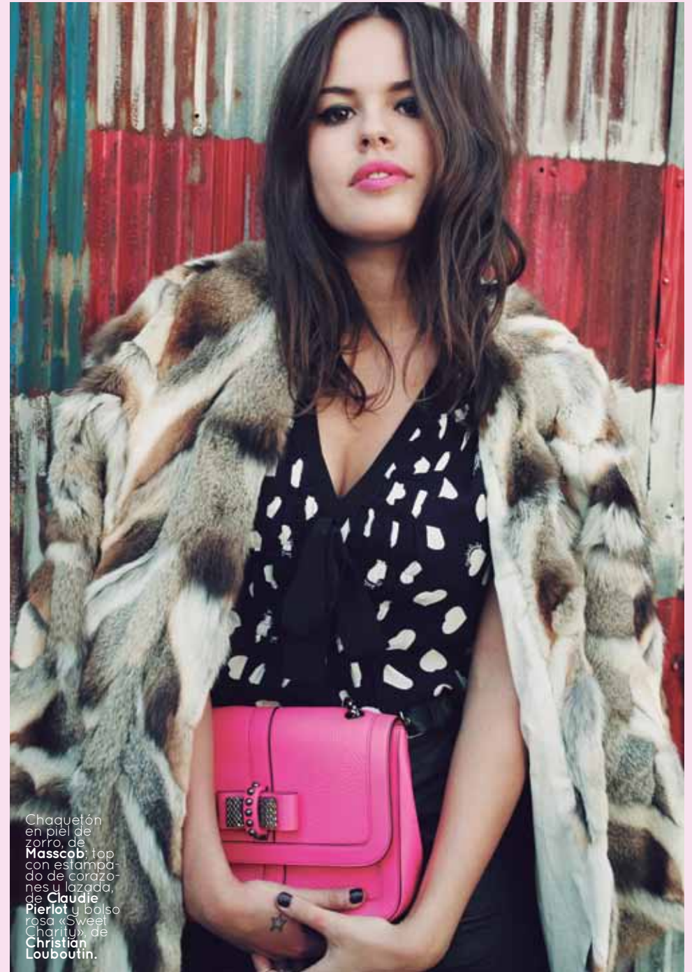
Chaquetón en piel de zorro, de Masscob; top con estampado de corazones y lazada, de Claudie Pierlot; y bolso rosa «Sweet Charity», de Christian Louboutin.

por Julia Urgel estilismos Florence Reveillaud