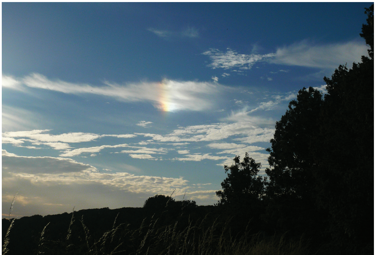
Figuur 1 Rechterbijzon. Deze vlekvormige halo staat even hoog boven de horizon als de zon zelf, op een hoekafstand van 22^\circ van de zon. De roodgekleurde begrenzing van de vlek is aan zijn zonzijde. Een bijzon kun je, bij het waarnemen door een polarisatiefilter, heen en weer laten schuiven. Dit is het beste te zien als men het oog richt op de rode binnenkant. Uit de grootte van de verschuiving laat zich de dubbelbreking van ijs berekenen.