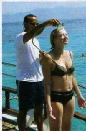
SERVICE: Den greske kapteinen om bord på Marco Polo dusjer alle som har tatt seg et bad midthavs etter besøk på Paxos.

Vil du spasere, gå fra Parga til Ali Pasha Castle, med lunsj i landsbyen Anthoussa. Start tidlig om morgenen – før det blir for varmt.