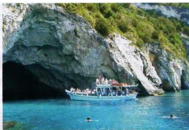
FINE GROTTER: Båttur til Paxos med Marco Polo: Du kan shoppe og spise lunsj i Paxos, snorkle fra båten og bade i grotter.