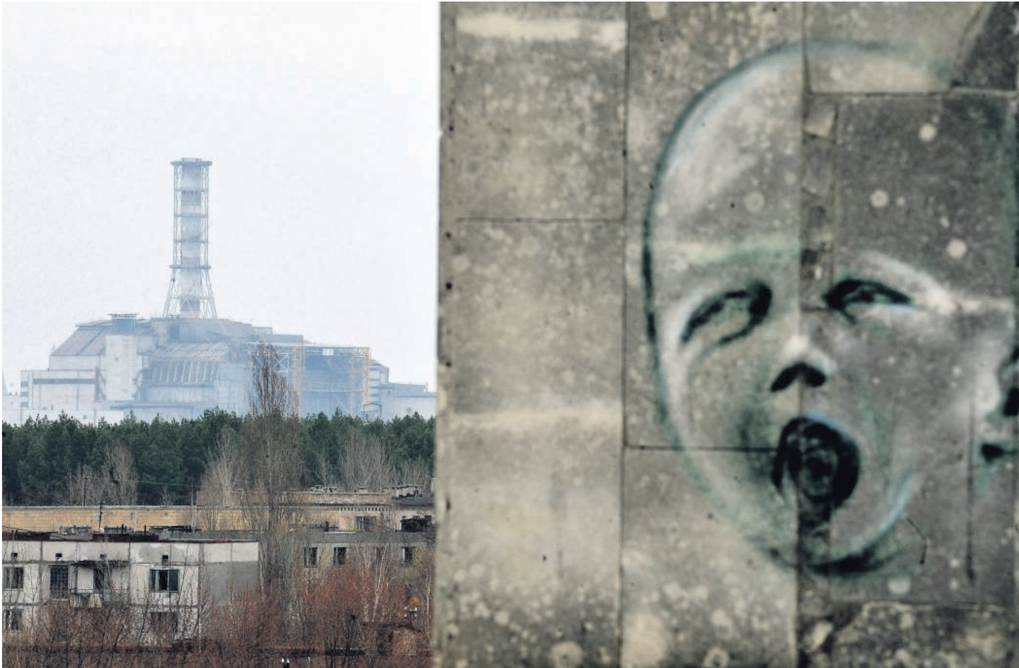
De Tsjernobyl-reactor tegenwoordig. Tientallen Nederlandse investeerders staken geld in een ambitieus project om de wijde omgeving van de ramp uit 1986 stralingsvrij te maken. Van de initiatiefnemers wordt niets meer vernomen en het geld is verdwenen.