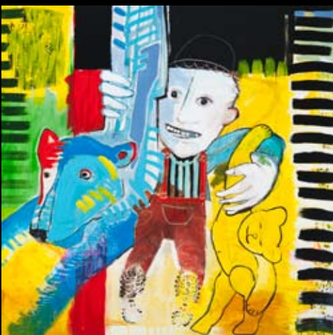
"Grib en tiger!" 150 x 150 cm