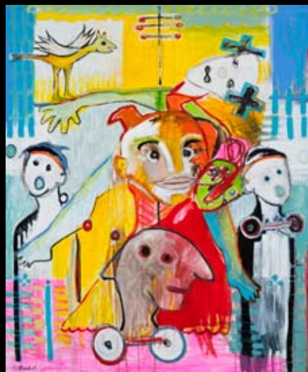
"Multitasking" 100 x 120 cm