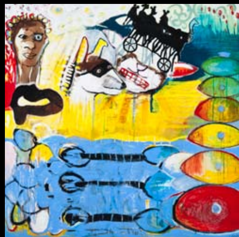
"Change" 150 x 150 cm