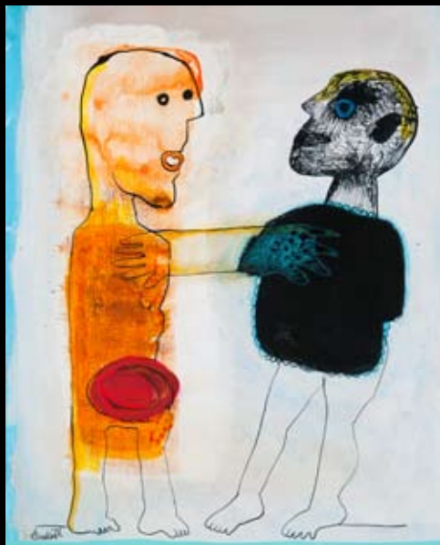
"Gensidig forståelse" 30 x 38 cm