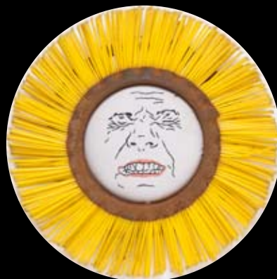
"Alt" børster og broderi