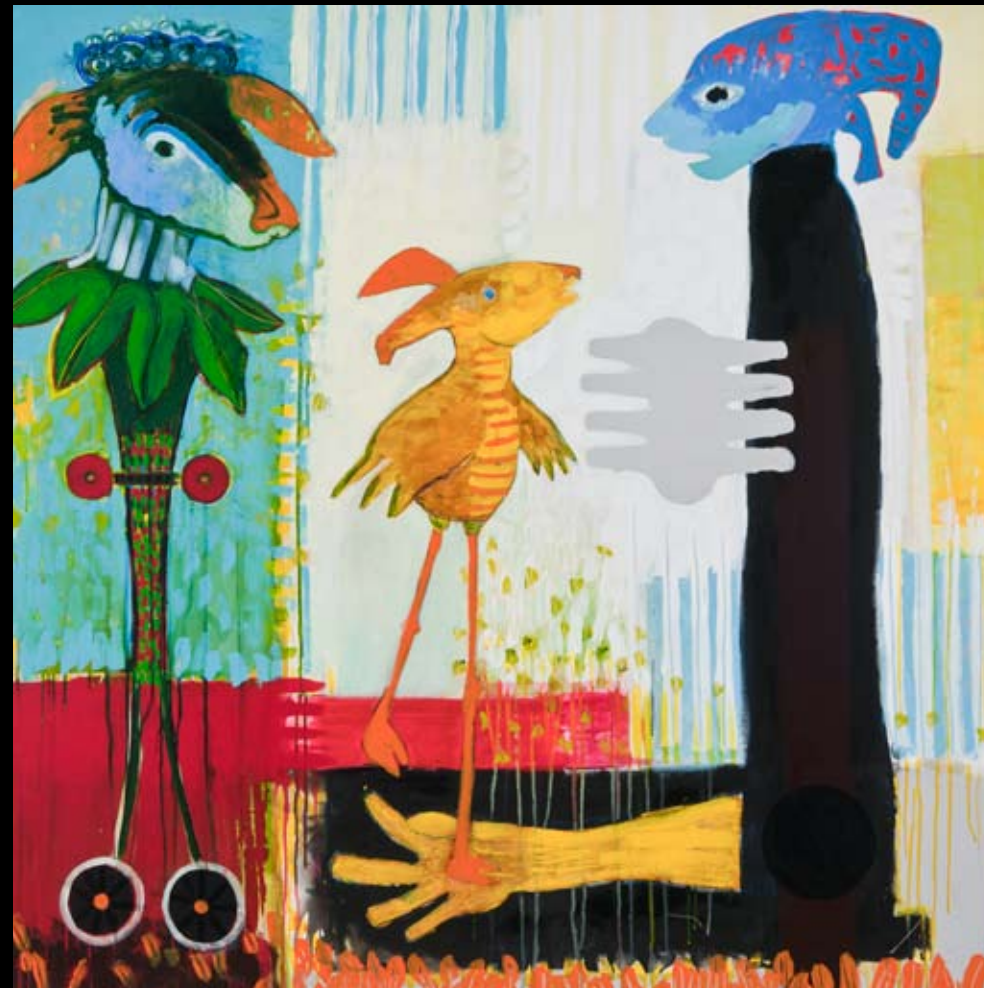
"Samtale om jordforbindelse" 150 x 150 cm