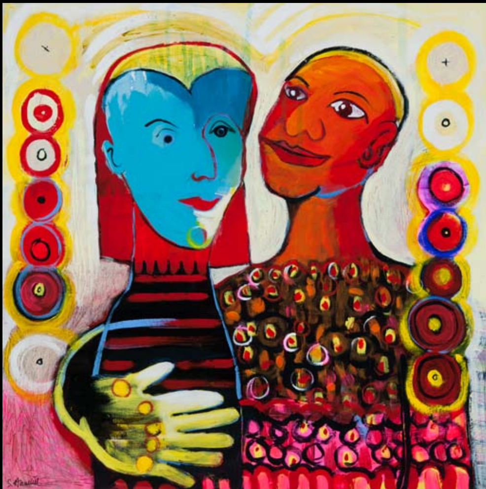
"The couple! 100 x 100 cm