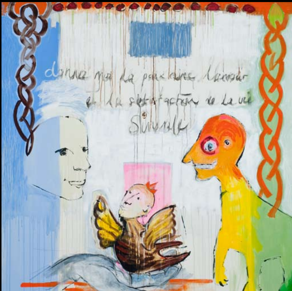
"Til-lid" 150 x 150 cm