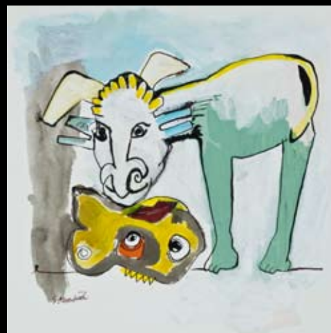
"Observation" 25 x 25 cm