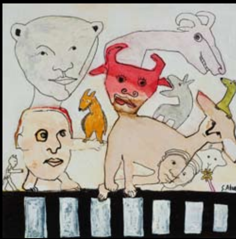
"Passagen" 25 x 25 cm