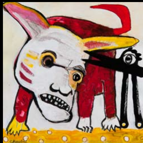
"Fåresaksens hemmelighed" 25 x 25 cm