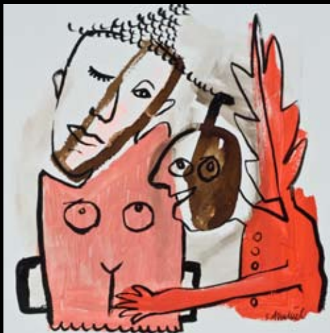
"Parlez vous...?" 25 x 25 cm