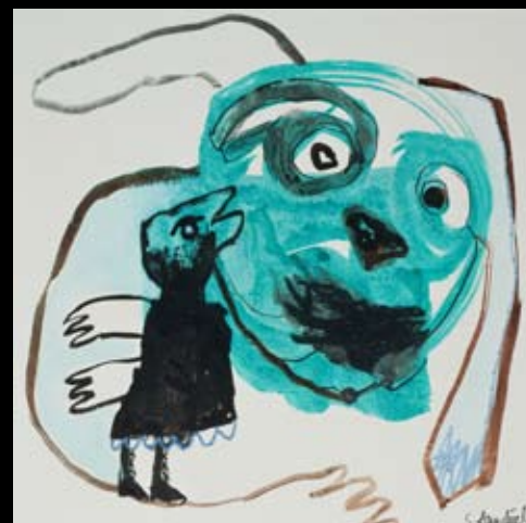
"Overleveringen" 25 x 25 cm