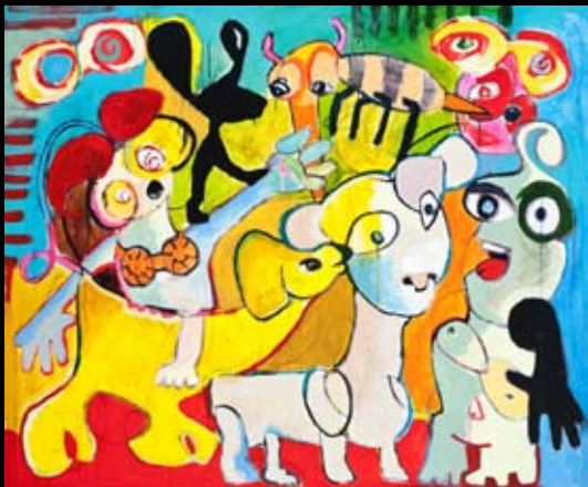
"Network" 120 x 100 cm