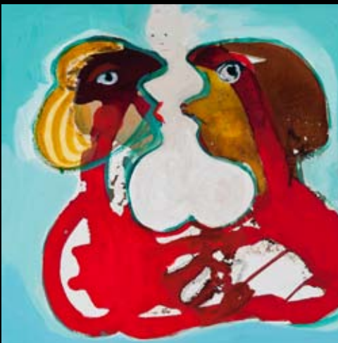
"Kærlighedens engel" 40 x 40 cm