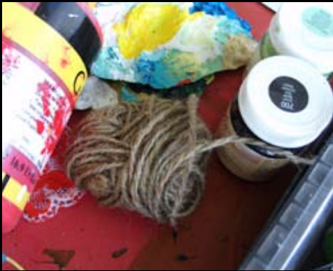
"Hjerneregistreringen" 150 x 150 cm