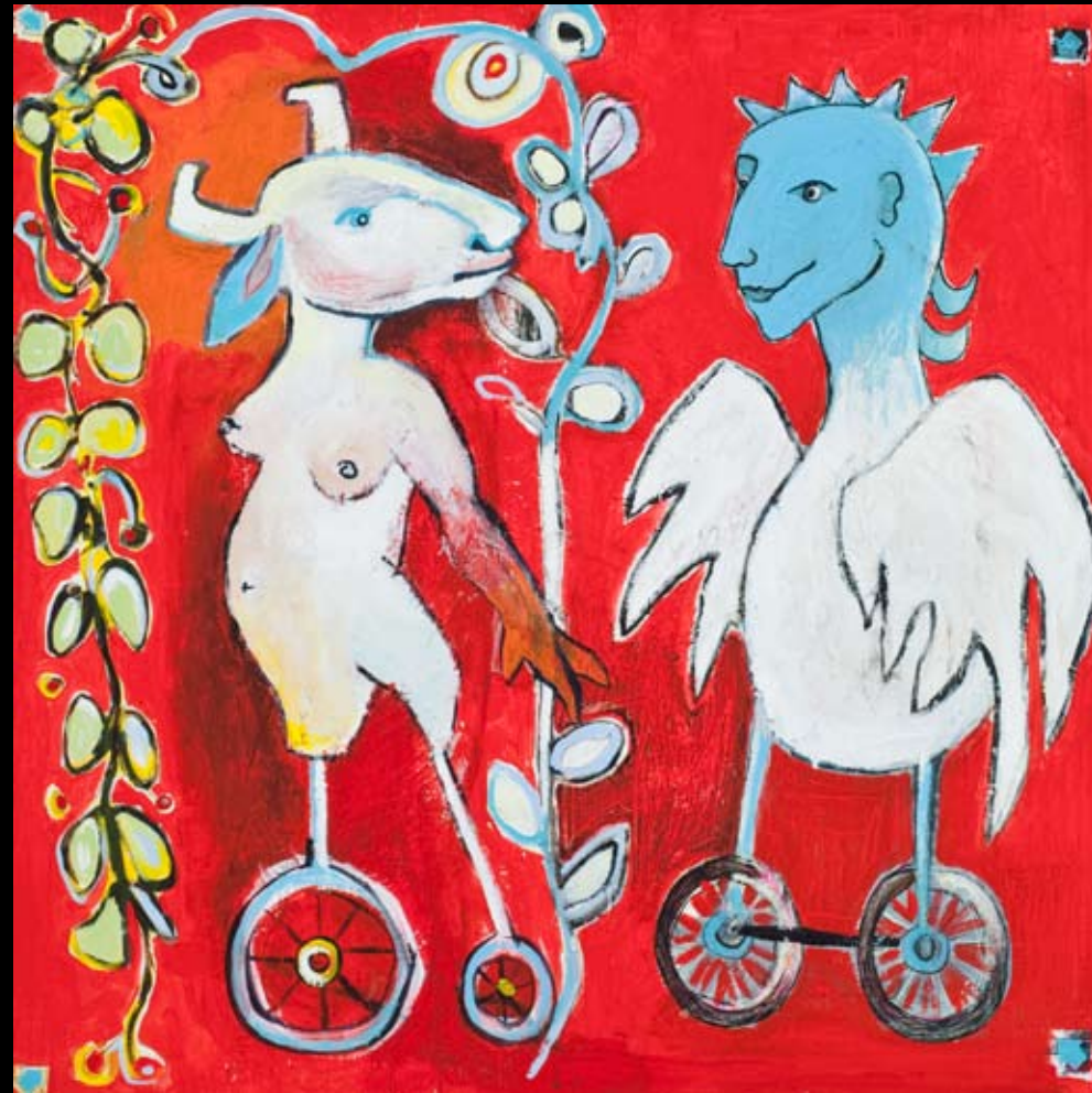
"Paradiset" 100 x 100 cm