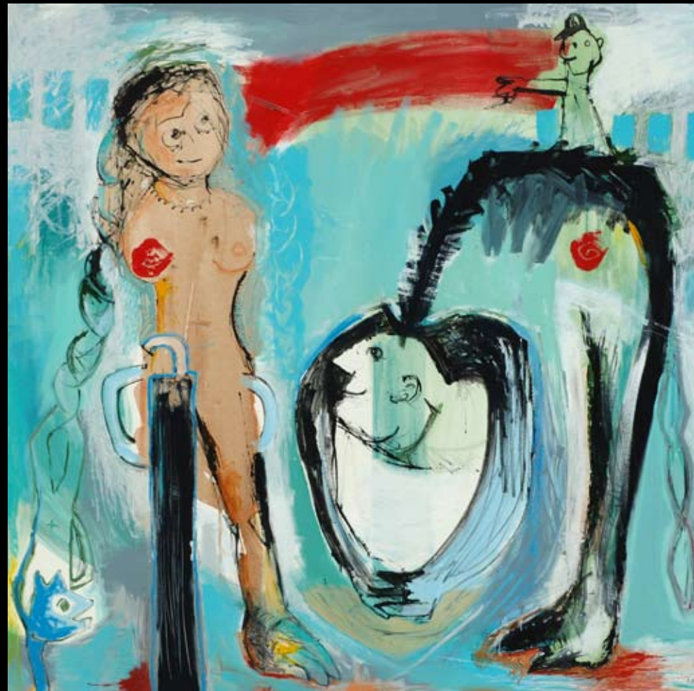
"Hvor-om-alt-ting-er" 150 x 150 cm