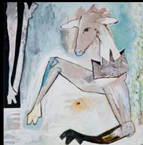
"Distraction is a pain in the ass!" 100 x 100