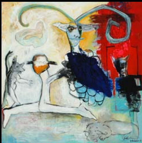
"Hel-lige balance" 150 x 150 cm