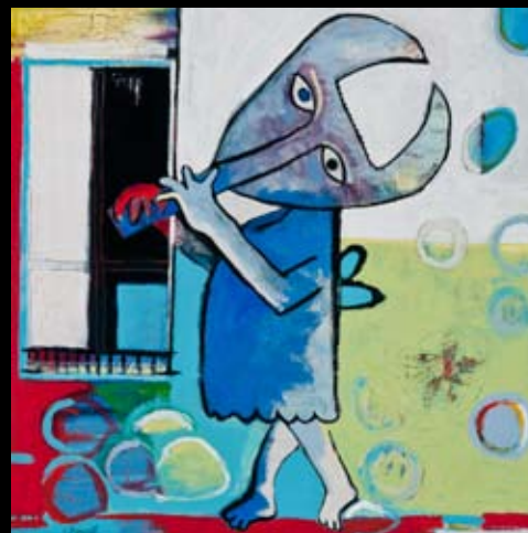
"At fløjte sten om til luft" 60x60 cm