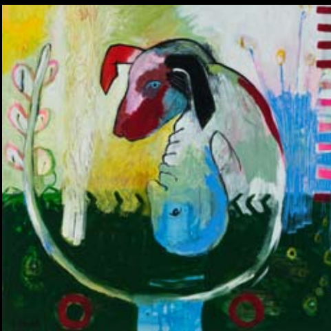
"Den ydre svinehund" 100 x 100 cm