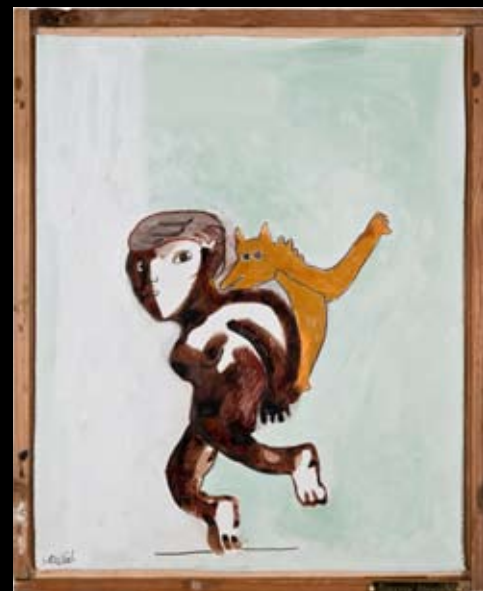
"I'm with me" 30 x 38 cm