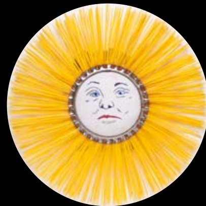
"Stor sol" børster og broderi