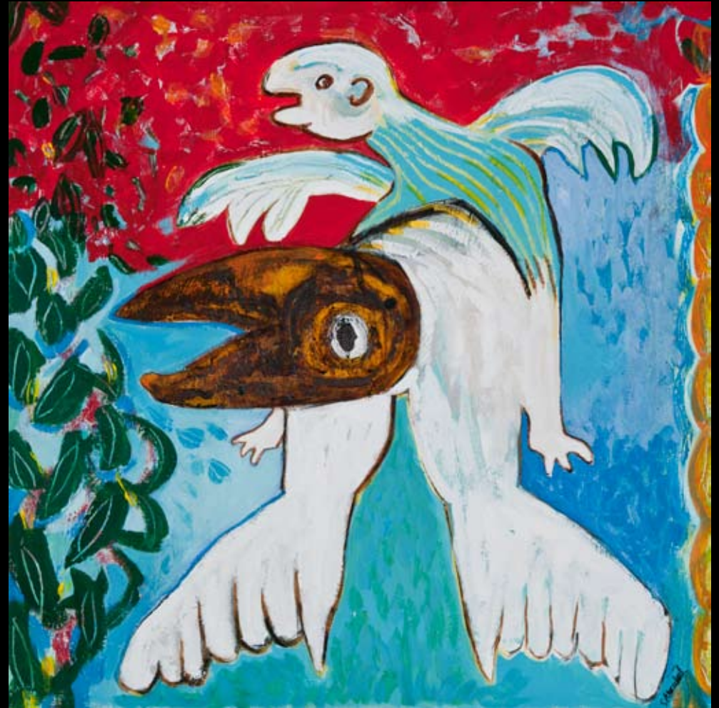
"Frihedsrytteren" 60 x 60 cm