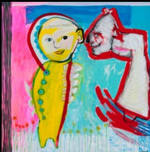
"At være lyttende..." 100 x 100 cm