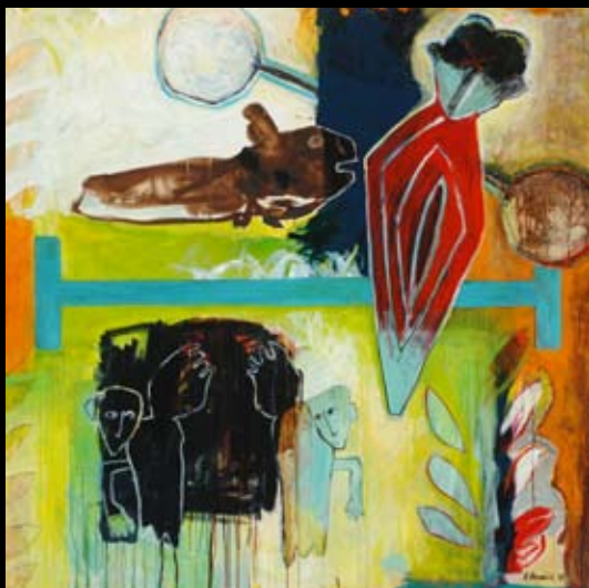
"The erection of the future" 150 x 150 cm