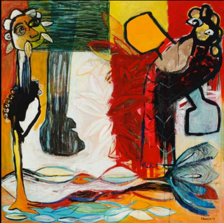
"Ping-pong-tabu" 150 x 150 cm.