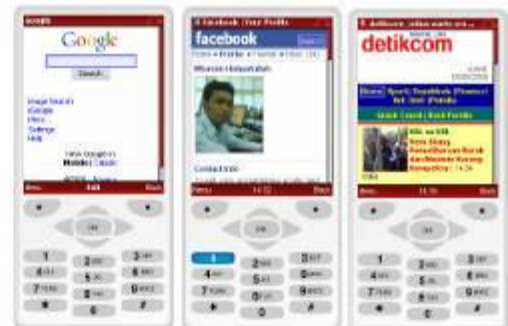
Google, Facebook, Detik, dll