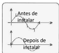
Filtra a corrente e a onda de energia sinoidal

• Basicamente, funcionam como filtros activos que actuam no factor de potência, nos picos de corrente, nas distorções harmónicas e noutras interferências fornecidas pela rede eléctrica. A principal novidade dos controladores está no facto de poderem reduzir efectivamente o consumo da energia activa.