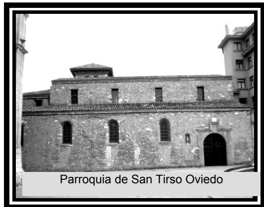
Parroquia de San Tirso Oviedo

La Santa Misa por los Hermanos fallecidos tendrá lugar el día 9 de enero, sábado, a las 12 de la mañana en la Parroquia de San Tirso, Plaza de la Catedral, Oviedo.