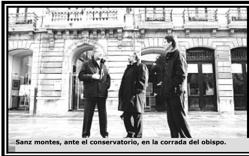
Sanz montes, ante el conservatorio, en la corrada del obispo.

Jesús Sanz Montes, nuevo arzobispo de Oviedo, entró, vestido de clergyman, en el palacio episcopal por primera vez y de forma resuelta declaró: «Llevo sólo unas horas y aunque vengo de incógnito ya es significativo que la gente me para por la calle. Estoy descubriendo un Oviedo con los brazos muy abiertos, como efectivamente así me han dicho que es la gente de esta tierra, profundamente hospitalaria y acogedora. No deja