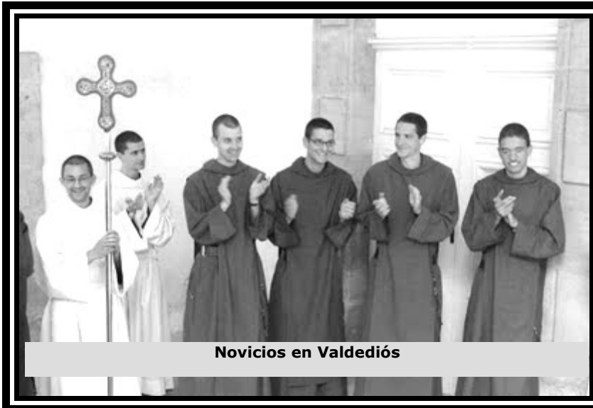
Novicios en Valdediós

(1) Lamenta de un modo especial que no pueda estar al completo su Comunidad en esta celebración ya que mañana será la llegada de un grupo de novicios que se formarán en Valdediós.