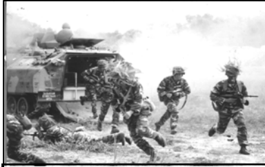
Pasukan tentera darat sedang membuat latihan menghadapi peperangan.