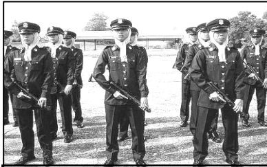
Pasukan polis sedang menjalani latihan kawad.

4. Gambar berikut menunjukkan peranan anggota keselamatan di negara kita.