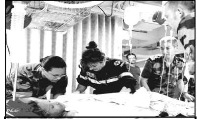
Pasukan tentera udara sedang memberi bantuan kecemasan.

(a) Jelaskan dua nilai yang ditunjukkan oleh anggota keselamatan.