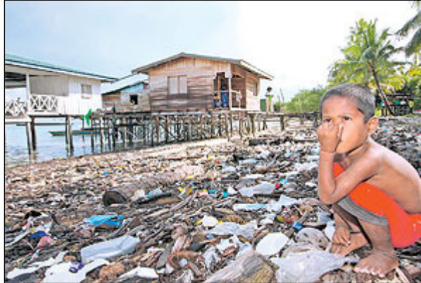
(Utusan Malaysia: 24 April 2010)

Gambar di atas menunjukkan seorang kanak-kanak yang tidak tahan dengan bau yang meloyakan di sepanjang pantai.