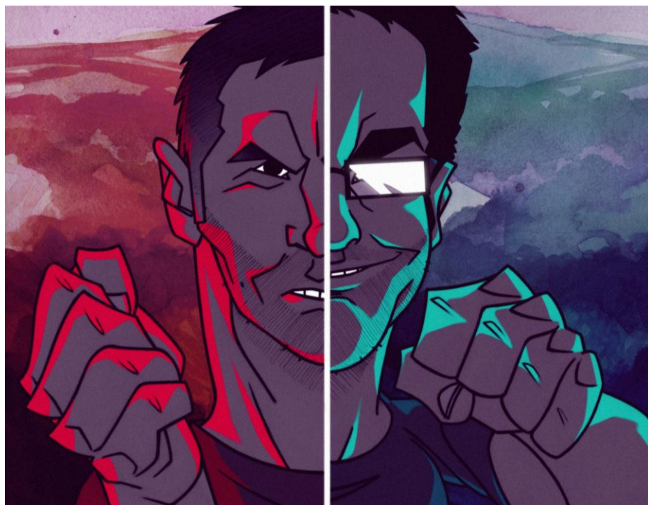
Sággy és Dragon újra és újra összecsapnak