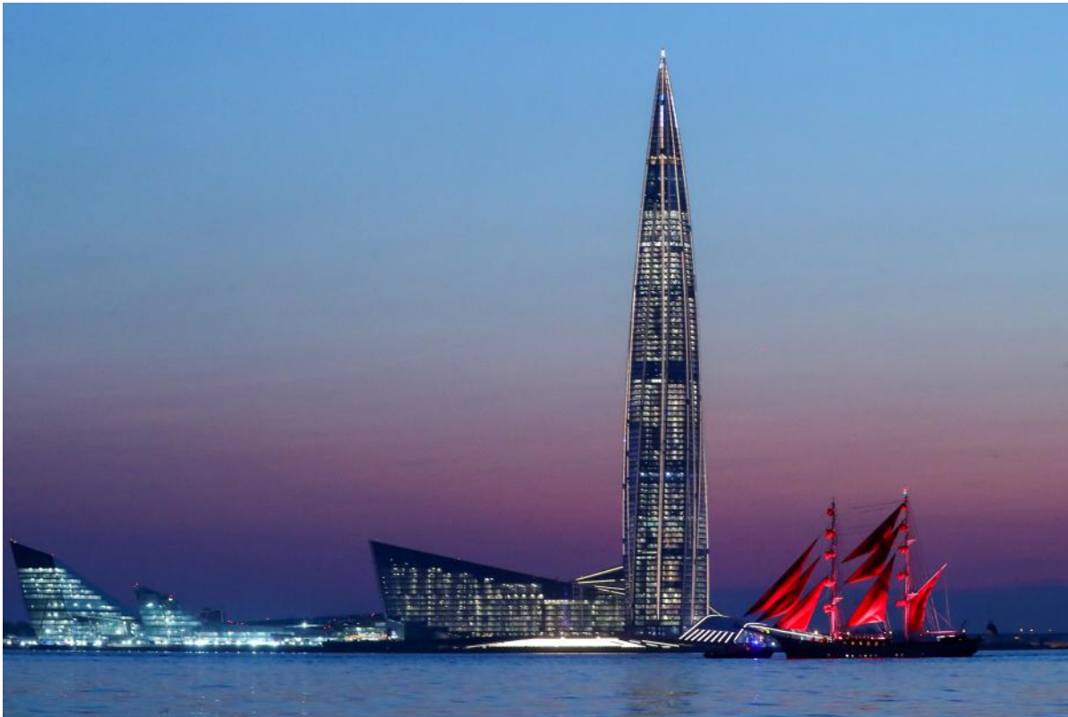
Der 2019 eröffnete und 462 Meter hohe Lakhta Tower in St. Petersburg ist das höchste Gebäude Europas

Ein dynamisch wirkender Turm, ein knapp 200 Meter hohes Atrium und Luxusapartments mit Blick über ganz Manhattan - so spektakulär präsentieren sich die neuesten und exklusivsten Wolkenkratzer rund um den Globus.