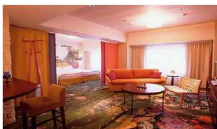
“Deluxe” de Hotel New Otani (ejemplo)