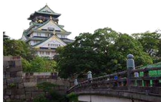
Castillo de Osaka