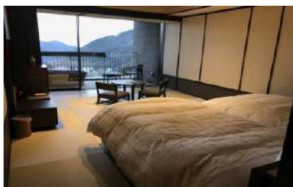
Hab. Japonesa de Ryokan Kowakien Tenyu

(8) Si los clientes tienen preferencia de habitación fumador o de no-fumador deben hacer solicitud, aunque no lo podemos garantizar ya que depende de la disponibilidad de cada hotel. Si no hay ninguna petición expresa se solicitará habitación no-fumador a los hoteles, siempre sujeto a disponibilidad. Los casos informados una vez en Japón es posible que no puedan ser atendidos.