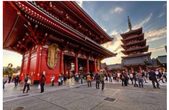
Templo de Asakusa Kannon

aprox. 08h00-08h30 Desayuno en el hotel. Reunión en el lobby y comienza la visita de la ciudad de Tokyo con guía de habla española para conocer el Templo Asakusa Kannon con su arcada comercial de Nakamise, el barrio Daiba y pequeño paseo en barco (*). aprox. 13h30 Almuerzo en un restaurante. El tour termina en el restaurante y el regreso al hotel es por su cuenta . Tarde libre para sus actividades personales.