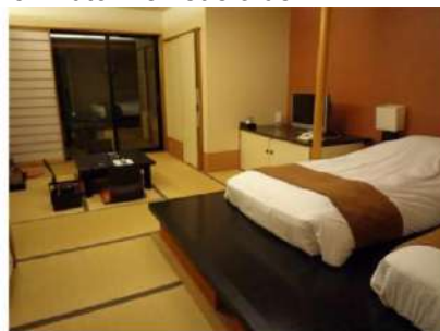
Hab . Japonesa de Ryokan Kowakien Tenyu Hab. japonesa de Ryokan Ryuguden