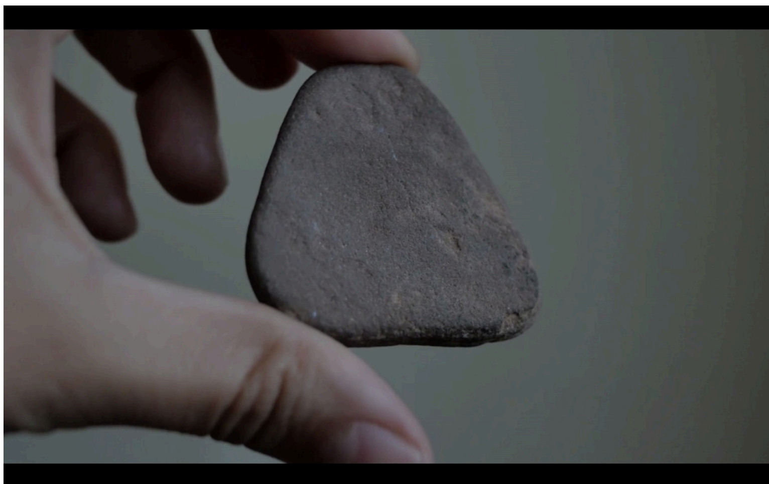
Imagen: Constanza Alarcón Tennen, Geological Resistance, 2016, still de video digital, 9:35 min.

por Artishock | Mar 2, 2017 | NOTICIAS |