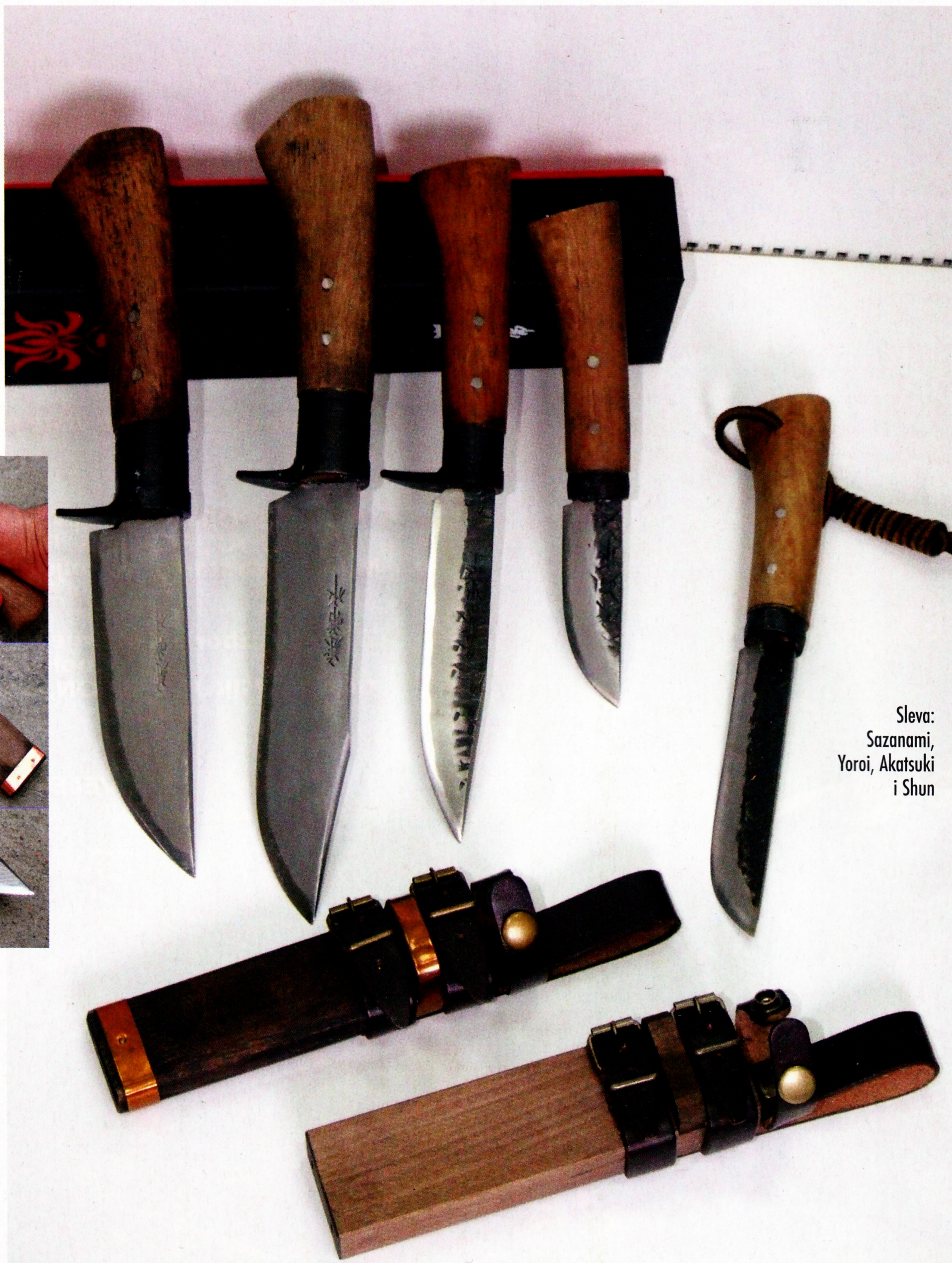
Sleva: Sazanami, Yoroi, Akatsuki i Shun

drške, sa praktičnom futrolom - prisutni su na celoj planeti.