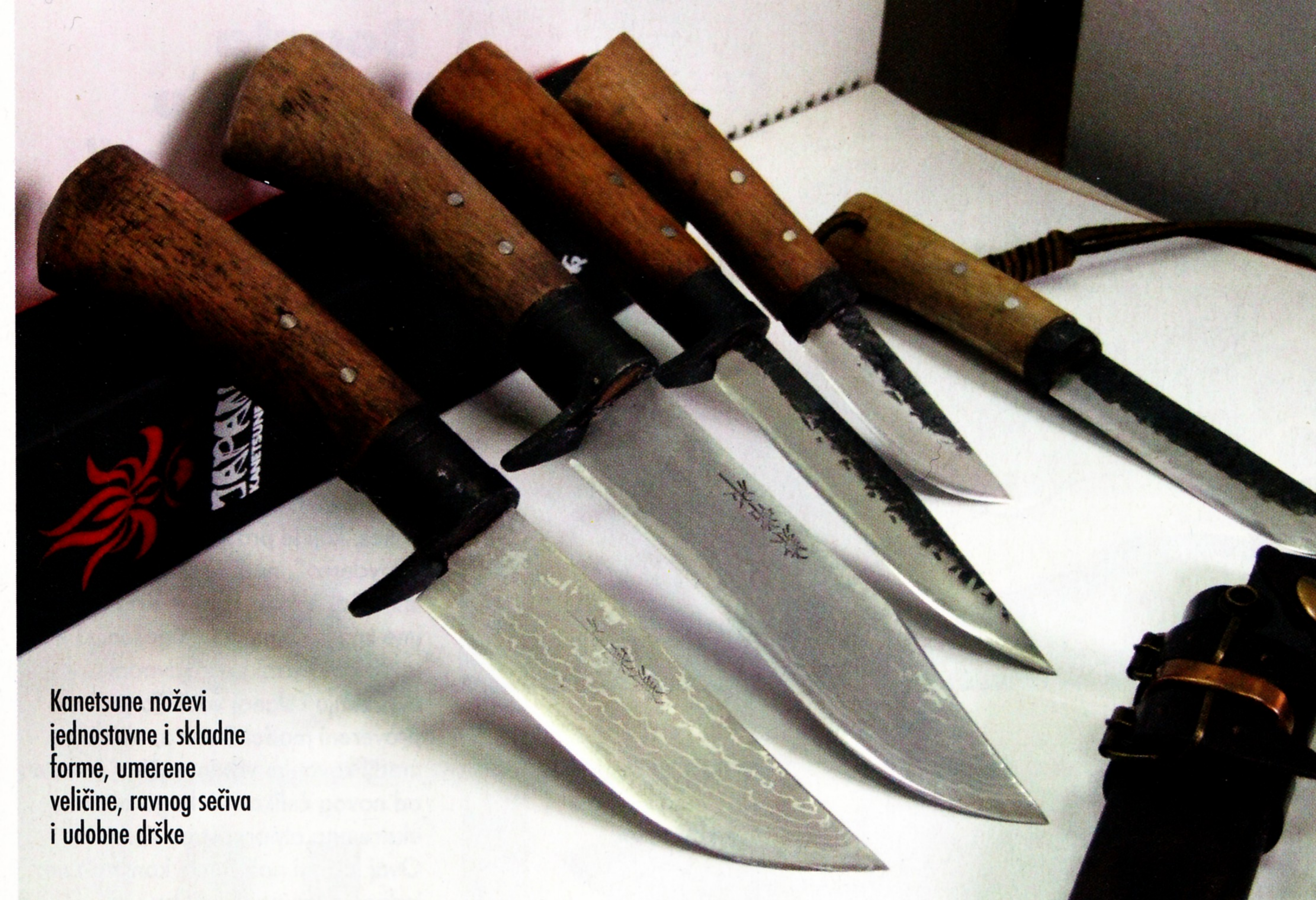
Kanetsune noževi jednostavne i skladne forme, umerene veličine, ravnog sečiva i udobne drške

aogami, sa dodatkom hroma zbog bolje otpornosti na koroziju i nešto veće tvrdoće. Materijali su ime dobili po boji hartije u koju su upakovani za transport. Po osobinama, smatraju se boljim od na Zapadu rasprostranjenog, ugljeničnog čelika 1095. Većina Japanaca radije bira nož od aogami čelika, nego uobičajene nerđajuće čelike, čak i kada se radi o kuhinjskim noževima. Poslovično uredni i disciplinovani, smatraju da je redovno održavanje noža, prihvatljiva cena za bolje držanje oštrice i povoljnije mehaničke osobine.