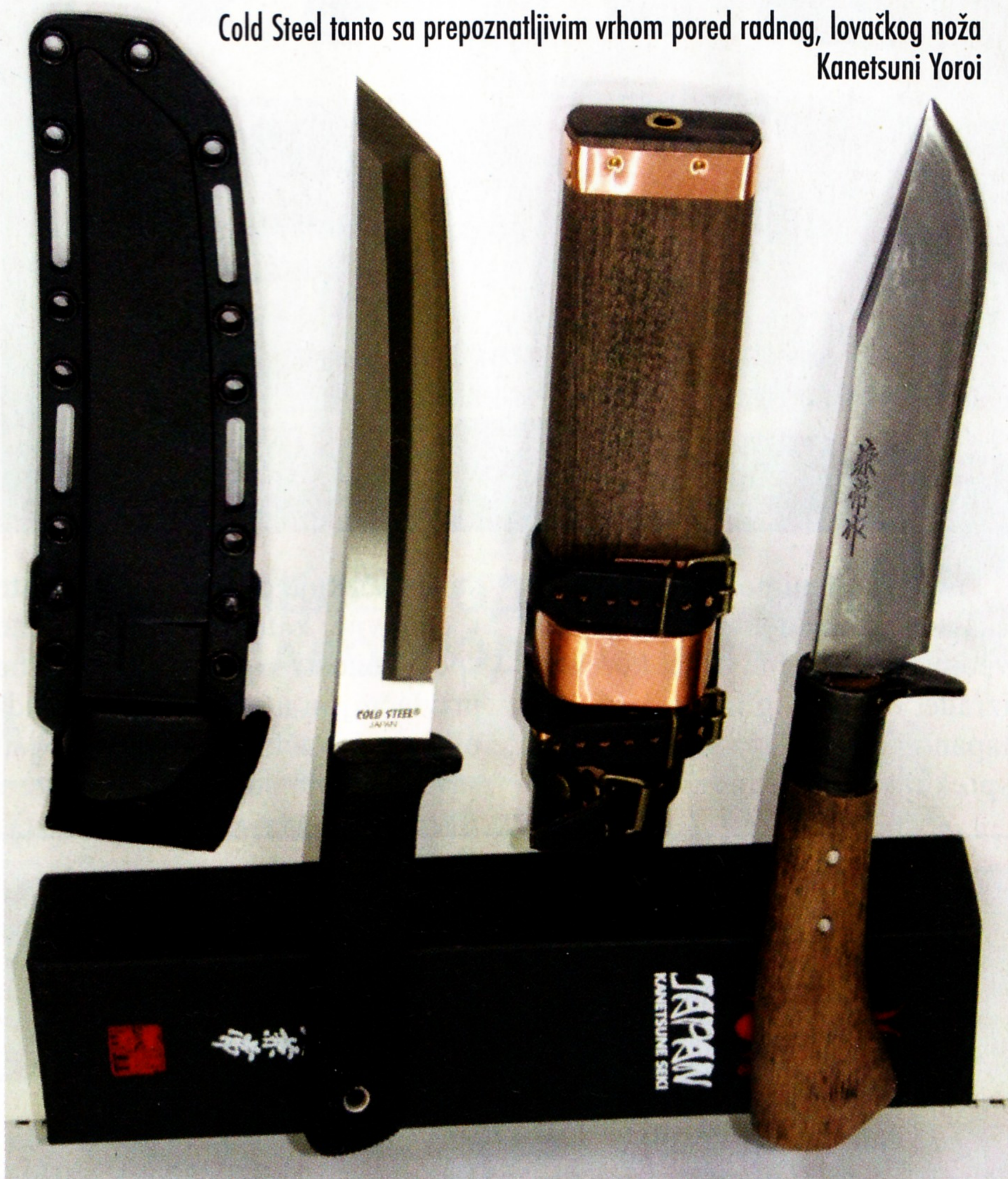
Cold Steel tanto sa prepoznatljivim vrhom pored radnog, lovačkog noža Kanetsuni Yoroi

jene lovačke modele, koji mogu da se kupe u bilo kojoj radnji sa lovačkom opremom, ali tu prestaje svaka sličnost. Najuočljivija razlika je kod futrole. Umesto kože, Kanetsune noževi dolaze u drvenim futrolama, neobičnog i dopadljivog izgleda. Urađene su poput drvenih kanija tzv. zutsu ili zaya za samurajski mač. Na nekim modelima su ojačane okovima od bakra, a na opasač se kače uz pomoć kožnog viska, što je rešenje najčešće viđeno na bajonetima. Vekovno iskustvo japanskih kovača, donelo je saznanje da je sečivo od visokougljeničnog čelika manje podložno koroziji, ukoliko se čuva u kanijama od drveta. Najcenjenija je bela magnolija, ali su i ostale vrste drveta dobar izbor.