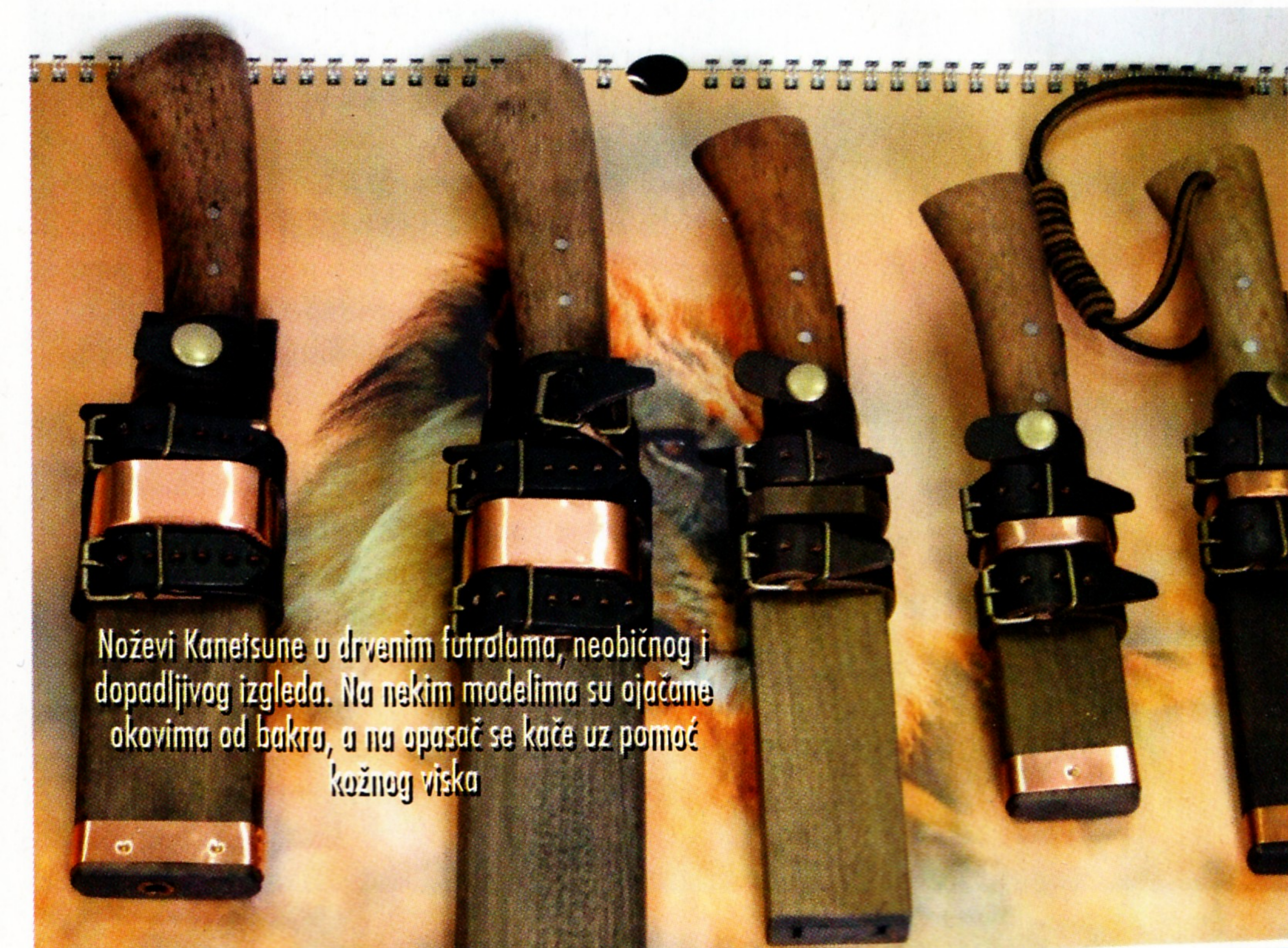
Noževi Kanetsune u drvenim futrolama, neobičnog i dopadljivog izgleda. Na nekim modelima su ojačane okovima od bakra, a na opasač se kače uz pomoć kožnog viska

Sazanami Mod. 265 je po obliku vrlo sličan prethodnom modelu, ali je njegovo sečivo od aogami čelika dugo 120 mm nešto šire i što je najvažnije, ravno brušeno celom visinom! Jedna od retkih zamkerki lovačkoj liniji Kanetsune noževa su tragovi kovanja na stranicama sečiva. Insistiranje na