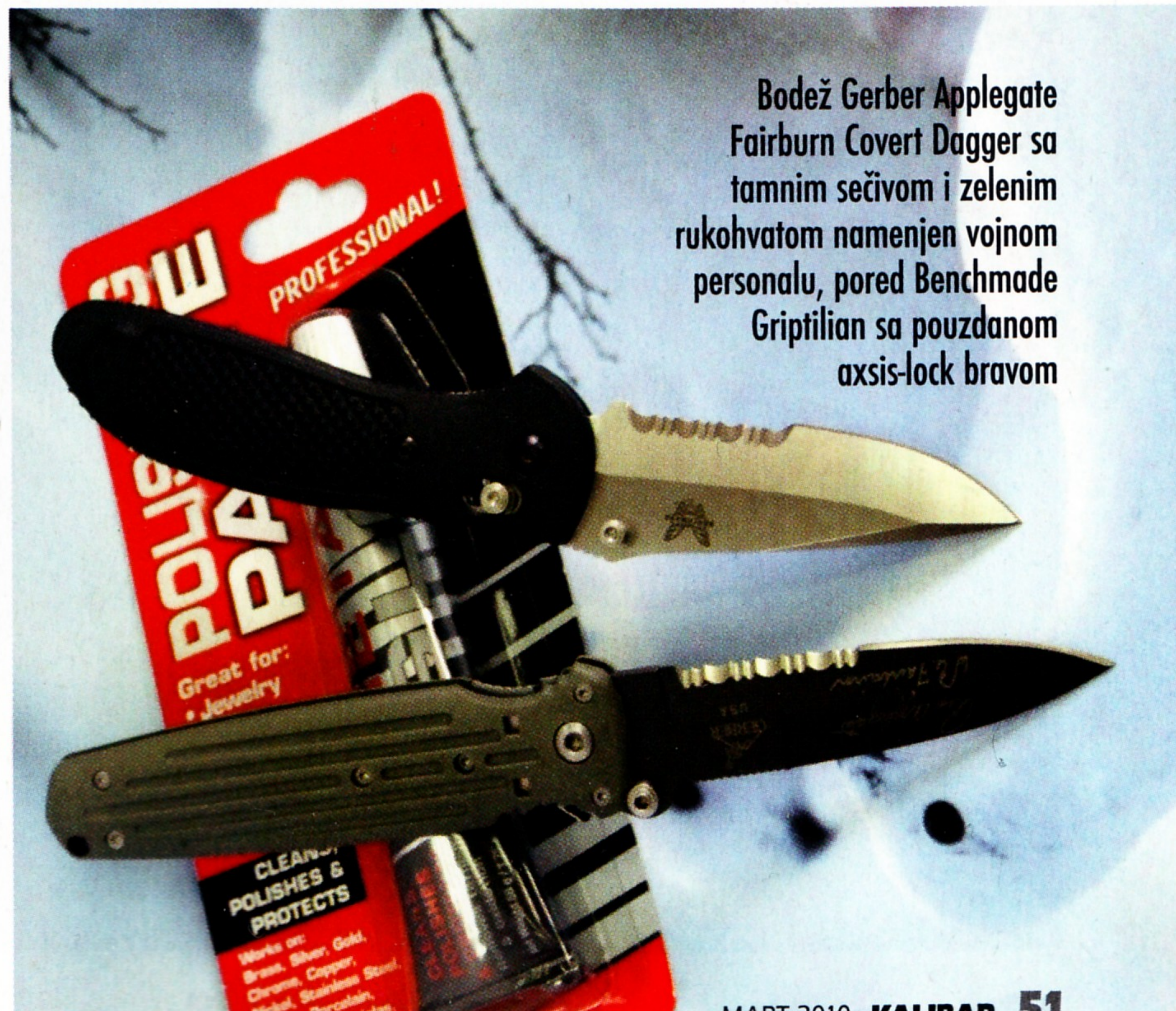
Bodež Gerber Applegate Fairburn Covert Dagger sa tamnim sečivom i zelenim rukohvatom namenjen vojnom personalu, pored Benchmade Griptilian sa pouzdanom axis-lock bravom